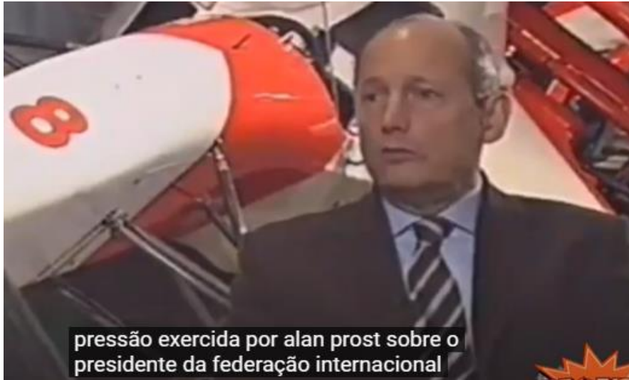
Imagem reproduzida do vídeo da entrevista de Ron Dennis sobre Prost no Japão 1989.

Anos mais tarde, Ron Dennis confirmou em entrevista em vídeo, que Prost pressionou Balestre para manipular o resultado do GP Japão 1989.