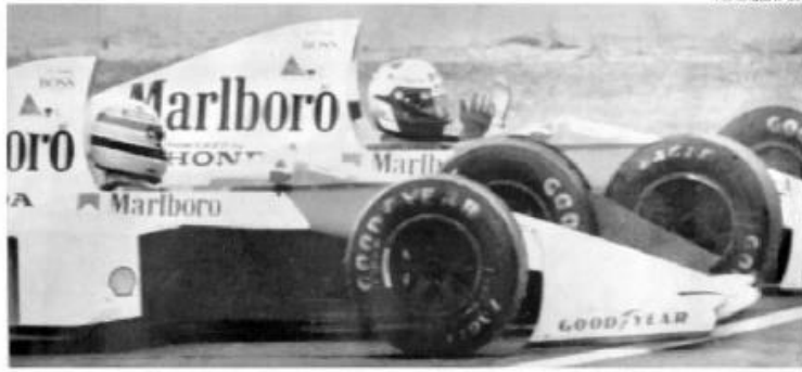
O auge da tensão. Senna e Prost colidem numa chicane no GP do Japão, na polêmica decisão do título de 1989

— Pela primeira vez eu vi Alain tenso. Ele havia alcançado o status de número um na equipe e, de repente, havia um jovem que tinha total noção do que era ser competitivo — lembrou o chefe da