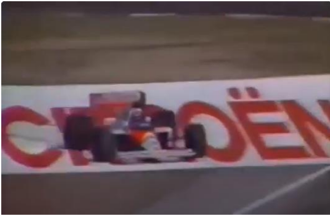
Jornal O Estado de São Paulo 06/11/1996 pg 36.

No GP San Marino 89, Prost cortou a chicane na volta 45, mas não foi punido. Se fosse seguir o critério da punição de Senna no GP Japão 89, o francês deveria ter sido punido.