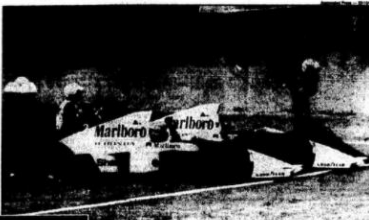
Depois do choque com Williams, em 89, no Japão, Prost vai de novo a Senna para ser punido por omissão

MILAN/ITALIA Ayrton Senna, com sua fama de "balestra", não se dá por vencido. O brasileiro admite ter ajudado Prost a vencer o GP de San Marino em 1989, o que lhe valeu a fama de "balestra". Senna, no entanto, não se dá por vencido. O brasileiro admite ter ajudado Prost a vencer o GP de San Marino em 1989, o que lhe valeu a fama de "balestra".