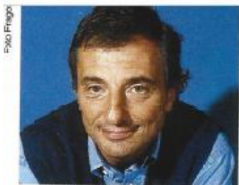
RICCARDO PATRESE Vice-campeão mundial de 1992 com uma Williams

“O Williams FW 14 é o carro que me deixou as melhores lembranças e as maiores emoções. Era um carro fantástico e muito competitivo. Aerodinâmica perfeita, bom chassi e acima de tudo um motor excelente motor. O Renault V10 não era apenas potente e suave, era também muito resistente. No ano seguinte a versão FW 14B era ainda mais competitiva, tinha suspensão ativa e vários dispositivos eletrônicos... Era cansativo de dirigir por causa das velocidades muito elevadas nas curvas.” (Patrese, Revista Carro F1 2000 pg 23)