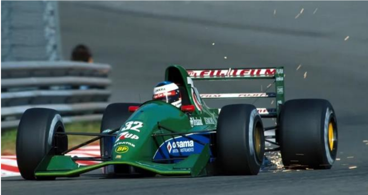
Foto do bico alto da Jordan 1991, com o mesmo conceito do Bico da Tyrrell 1990. O objetivo desse bico era impulsionar o ar para baixo do carro e fazê-lo percorrer o assoalho o mais rápido possível para gerar downforce com o mínimo de arrasto aerodinâmico. Esse conceito foi usado pela Benetton Tubarão.